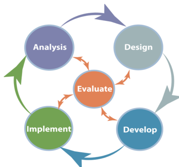
Gambar 1. Tahapan Model ADDIE

Dalam penelitian ini, model penelitian pengembangan (R&D) digunakan untuk membuat produk tertentu dan menguji seberapa efektif produk tersebut (Sugiono, 2015:407). Kami menggunakan model ADDIE untuk penelitian ini karena model ini sering digunakan untuk menggambarkan pendekatan sistematis untuk pengembangan instruksional dan berfungsi sebagai pedoman untuk membangun perangkat dan infrastruktur yang efektif, dinamis, dan mendukung kerja pelatihan itu sendiri. Model ADDIE terdiri dari lima langkah, yang meliputi: